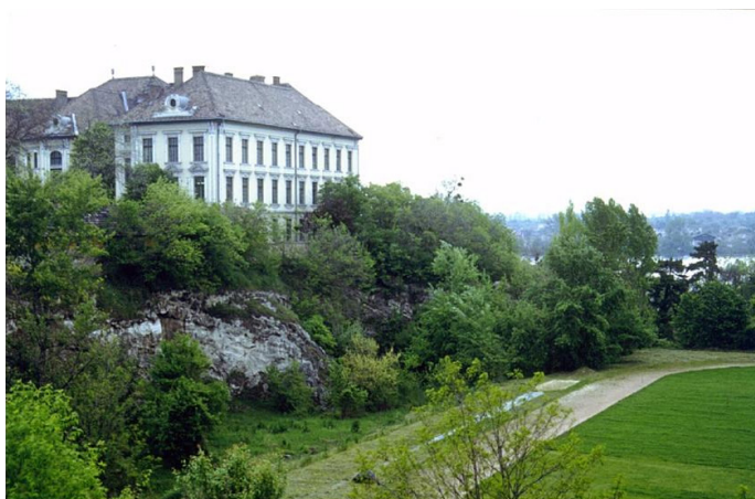
1. ábra. A lelőhely a gimnázium épületével, és az Öreg-tóval. // Figure 1. The site with the school building and the Öreg-tó (Old Lake).

*** Artefacts that are separated earlier from the excavated material, and other pieces found during excursions and site maintenance.