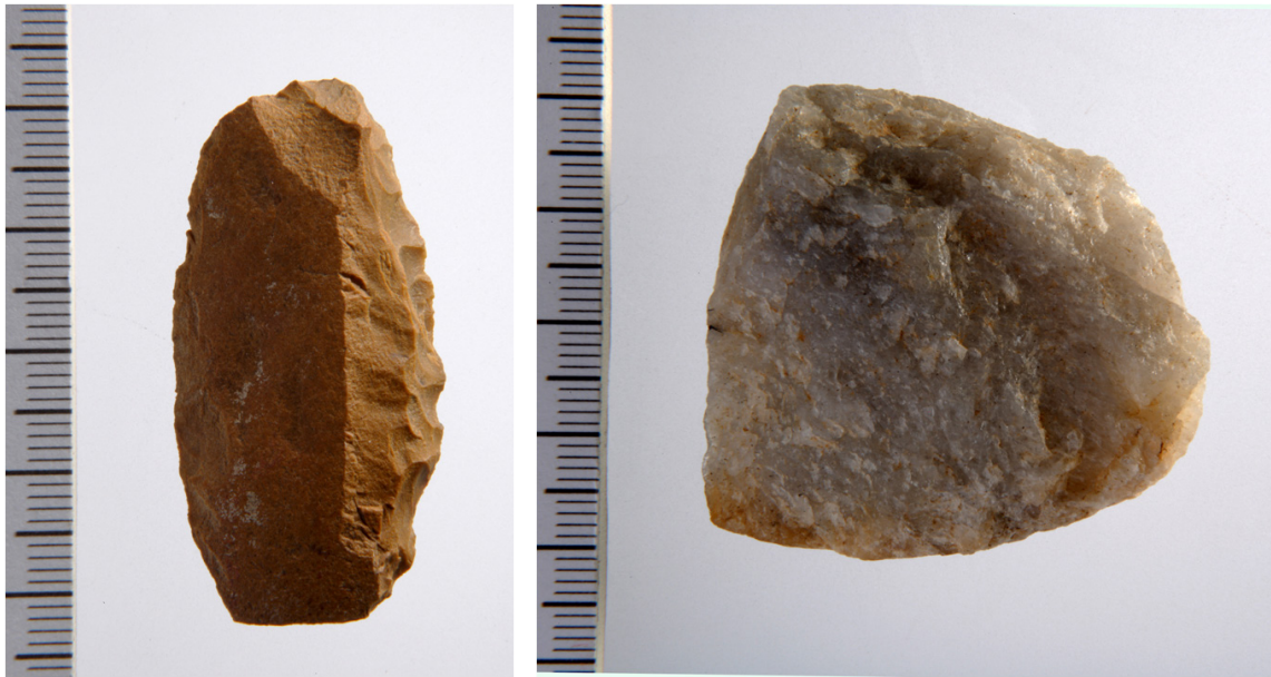
5. ábra. Tata eszközök. Balra - szegletes kaparó; jobbra - kvarcít gerezd. // Figure 5. Tata, tools. Left - square side-scaper; right - quartzite segment.