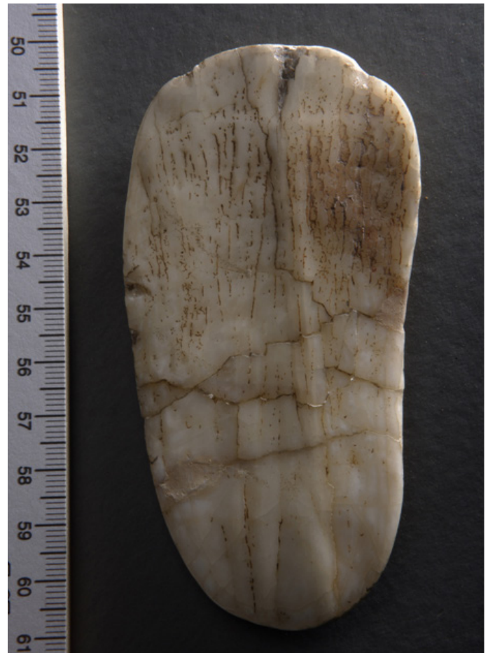
7. ábra. Csiszolt mamutfoglemez. // Figure 7. Polished mammoth tooth plaquet.

Vértés 40% körülire becsülte a tömbnyersanyagot ( Silex ). Beszerzési helyeként a Kálvária-hegy jura kori tűzköves rétegeit valószínűsítette. A néhány száz méterre lévő dombtetőn rézkori bányagödrök kerültek elő. Ezeket olyan, a felszínre kiékelődő kibúvákat követve nyithatták, amelyek a paleolitikumban is hozzáférhetőek lehettek. Távolabb, a Gerece számos pontján borítja a felszínt a felaprózódott pados radiolarit (pl. Pisznice-tető). Az időjárásnak hosszan kitett, felszíni kovatörmelék minősége folyamatosan romlik, kevésbé alkalmas a finom megmunkálásra. Az elhanyagolható