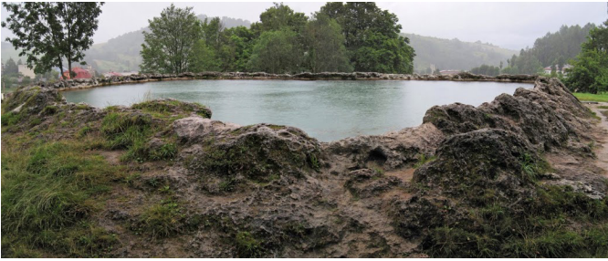
3. ábra. Vyšné Ružbachy (Felsőzúgó), mésztufamedence.